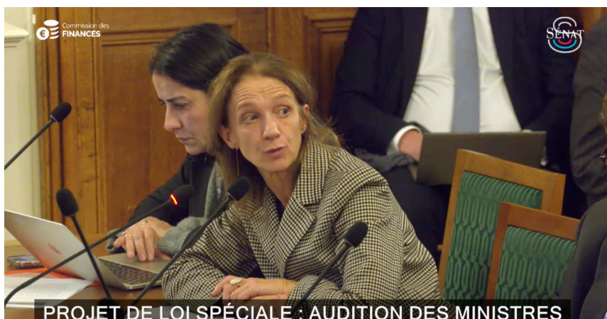
PROJET DE LOI SPÉCIALE : AUDITION DES MINISTRES

Une semaine après la censure du Gouvernement BARNIER et l'arrêt brutal des débats budgétaires au Sénat, nous entamons l'examen d'un projet de loi spéciale pour assurer la continuité du fonctionnement de l'État. J'ai interrogé les Ministres des Finances et des Comptes publics sur l'impact de cette situation pour les Universités.